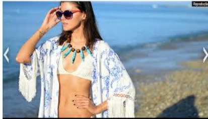
Posso usar Kimono como saída de praia?