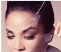
BELEZA SUTURA SILLHOUETTE, EFEITO REGENERADOR SEM PLÁSTICA