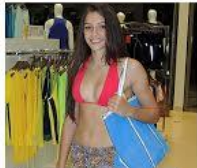
MODA TENDÊNCIAS MODA PRAIA PARA USAR AGORA